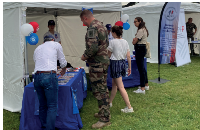
Journée des blessés/Terre

Opérateur de reconversion du ministère des Armées, Défense mobilité accompagne chaque année vers l'emploi des militaires blessés.